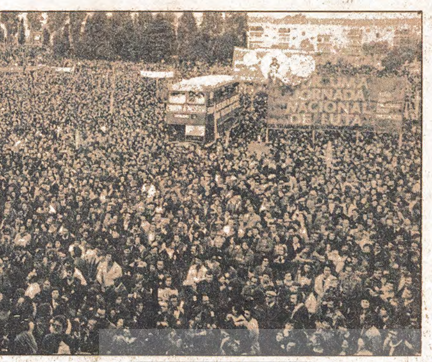
Sömürsüz bir dünya için emyonlonlarca emekçi sınıf mücadelesi barikatlarında

ABD'de, resmi verilerle 1974'te 500 bin işsizlik oranı 17 oldu. Resmi işsiz sayısı 7 milyon. Özellikle emekçi sınıfların, burjuva-revizyonist ideolojiler, bunalımlaşmış gelişen yeni kapitalist "Üzerine birçok teorileri yazdılar.